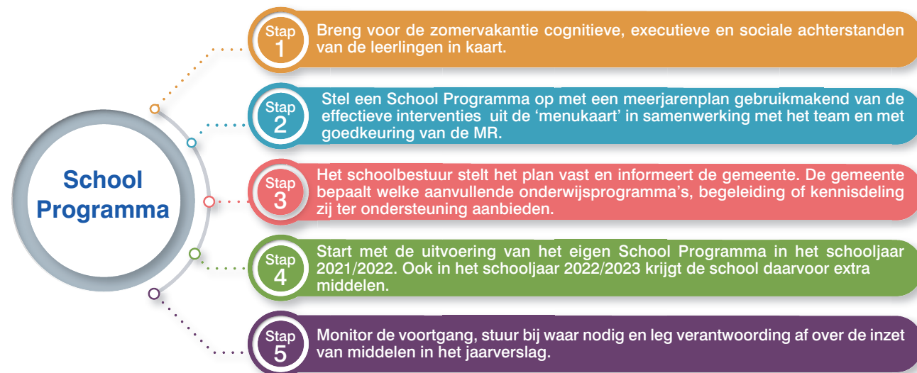
Het Nationaal Programma Onderwijs in 5 stappen.

(eerste lockdown) en op basis van een korte literatuurreview de verwachte effectiviteit hiervan in kaart te brengen. Uit deze inventarisatie (augustus 2020) blijkt dat aanvragen in de eerste tranche vooral gericht waren op verlengde schooldagen, ondersteuning tijdens schooluren en een vakantieschool voor leerlingen met een taal- of rekenachterstand en leerlingen die voorwaardelijk over zijn gegaan.